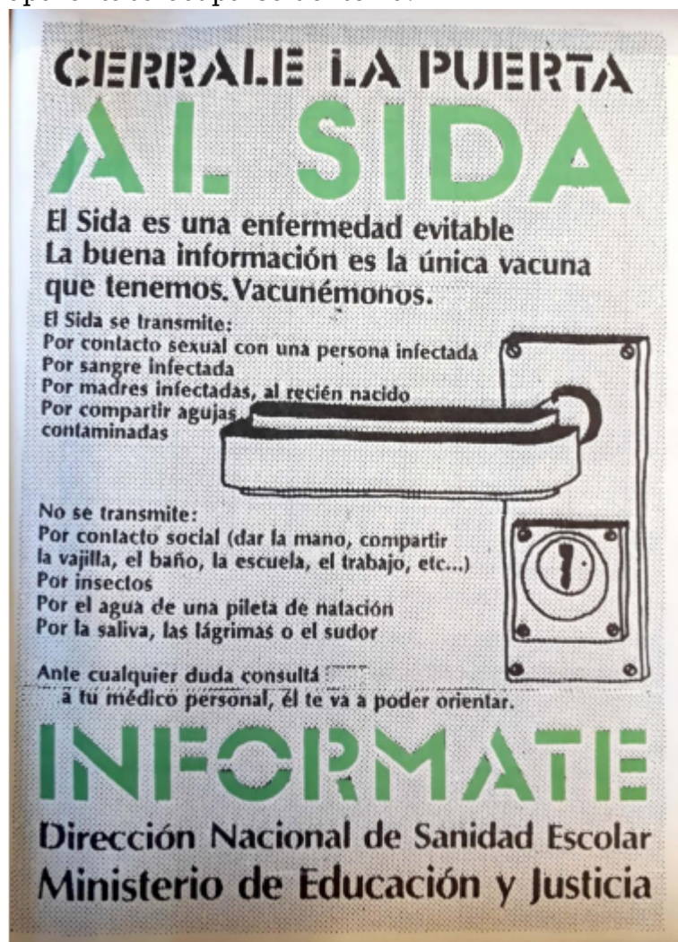
Imagen 1: Campaña de la Dirección Nacional de Sanidad Escolar y el Ministerio de Educación y Justicia (1987)

Por aquellos años, el Ministerio de Salud y Acción Social también lanzó una campaña con el objetivo de informar sobre la situación del Vih-sida. Al analizar con detenimiento los mensajes que transmitía se evidencia ya desde el titular que la palabra “vida” se privilegiaba en relación a la palabra “sida”, lo cual podría