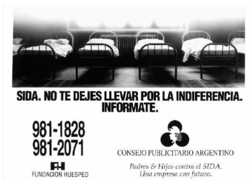
Imagen 4: Campaña “Camas” (1992)

La campaña combinaba las imágenes de camas vacías de un hospital junto a una locución en off que relataba lo siguiente: