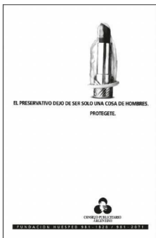
Imagen 6: “El sida y la mujer” (1994)

en relación con las campañas anteriores. De esta manera, lejos de instalar el terror, el mensaje buscaba promover la toma de iniciativa en relación al cuidado por parte de las mujeres a la hora de tener relaciones sexuales. En definitiva, se reconocía a la población femenina como sexualmente activa, pero se las ubicaba como las agentes responsables del cuidado.