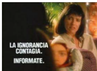
Imagen 5: “Madre e hija” (1992)