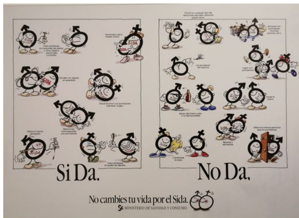
Imagen 3: Campaña “Si Da, No Da” (1988)

A estas campañas gráficas, le siguió la primera campaña audiovisual que se implementó en Argentina. Tuvo lugar en 1988, seis años después del primer caso de sida registrado en el país. La campaña Si Da No Da 26 fue importada desde España y tenía por objetivo informar sobre las vías de transmisión del Vih. Sucede que la forma en la que lo hacía era demasiado infantil en la medida en que hacía uso de unos dibujos animados que «no transmitían la urgencia del cambio de comportamientos, ni la importancia real del peligro de la enfermedad» 27 .