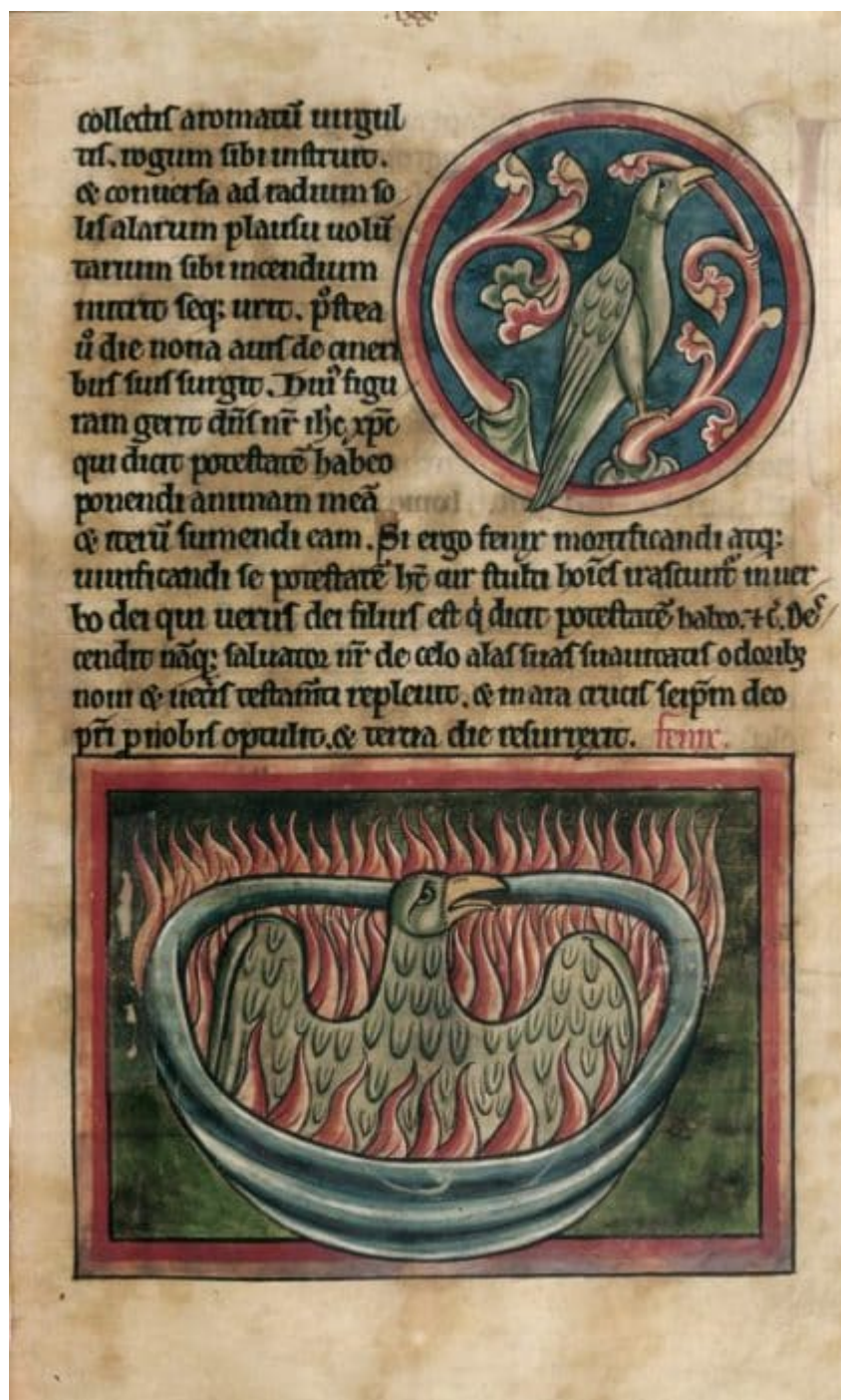
La fenice, miniatura tratta dal Bestiario, ms. Harley 4751, c. 45v, XIII sec., British Library, Londra