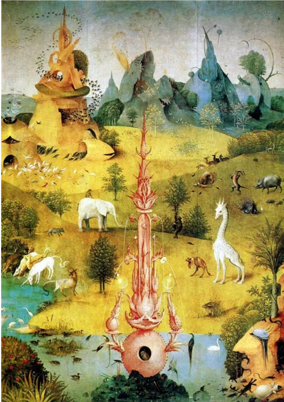
La giraffa, l'elefante e altri animali, particolare del Trittico del Giardino delle delizie , Hieronymus Bosch, 1503-4, Museo del Prado, Madrid

Strani animali in terra di Misr. Le testimonianze dei viaggiatori medievali tra realtà, esotismo e immaginazione