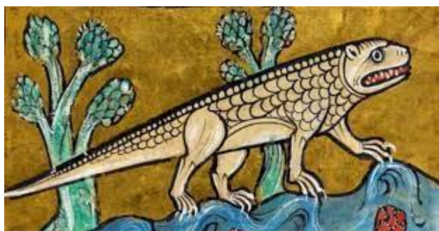
Cocodrillo, Bestiario Rochester, Inghilterra, XIII secolo, ms. Royal 12 F XIII, fol. 24r, British Library, Londra

serpenti (con «quattro piedi corti come gli orsi e una lunga coda nella quale si concentra tutta la loro forza; essi divorano tutto quello che trovano» 26 ) chiamati nella lingua locale “themesa”. Questi animali - evidentemente i cocodrilli - come altri, rendevano pericolosa la navigazione; ingurgitavano talmente tanto cibo che il più delle volte non riuscivano completamente a digerire, ed era per tale motivo che «la natura, maestra di tutte le cose ha creato dei piccoli uccelli» 27 che entravano nelle fauci dell’animale e si cibavano del surplus assorbito.