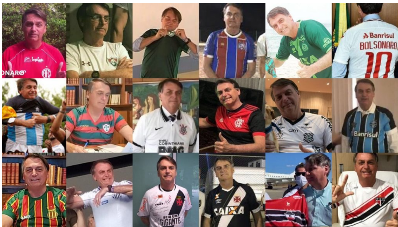
Figura 4. Bolsonaro con addosso alcune delle uniformi di club calcistici brasiliani.

connette le parti tra loro, e un legame verticale, che le unisce alla totalità che le ingloba. Un gioco di incastri e concatenazioni tra locale e globale che incontra nell'uso delle uniformi calcistiche una sua specifica espressione, capace di riaffermare, su scale diverse, il senso di appartenenza alla nazione, manifestato, a sua volta, dalla maglia giallo-verde della seleção 34 .