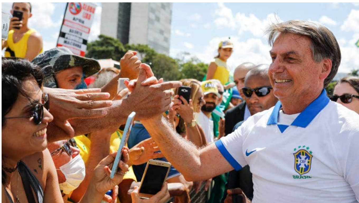
Figura 3. Bolsonaro durante una manifestazione del 15 marzo 2020 a Brasilia.

La lettura qui proposta non vuole certo fornire un'interpretazione ristretta e totalizzante di come abbia preso forma l'attuale scenario politico brasiliano, riconducendo tutto, successo di Bolsonaro compreso, al trauma del Mineiraço . Anche da un punto di vista sociosemiotico, e non soltanto politico ed economico, diverse e sfaccettate sono le dimensioni da tenere in considerazione se si vogliono comprendere i percorsi attraverso cui vi si è giunti. Ciononostante, credo che guardare al 7-1 sia comunque fondamentale per comprendere tanto la caduta di Dilma quanto l'elezione di Bolsonaro. Di fatto, ciò a cui si è assistito è traduzione tra la semiosfera calcistica e quella politica attraverso la mediazione di una terza semiosfera: quella mediatica, a cui si deve la cristallizzazione del